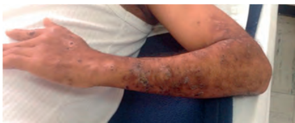
Figura 2 – Lesiones dorso brazo derecho. Nódulos entre 20 mm de diámetro, dolorosos, algunos confluentes. Dorso brazo derecho.

Posterior a la valoración en nuestra institución, se decide hospitalizar al paciente con diagnósticos de bicitopenia y neutropenia febril MASCC 23, por lo que se inicia cubrimiento antibiótico con piperacilina tazobactam 4,5 g intravenosos cada 6 h, además de suspender la dapsona y la clofazimina. Se indica un manejo integral óptimo para el paciente. Durante la estancia hospitalaria, el paciente presenta mejoría clínica y de la neutropenia, sin documentarse un proceso infeccioso, por lo que se considera suspender antibioticoterapia. Adicionalmente, por la presencia y la exacerbación de las placas