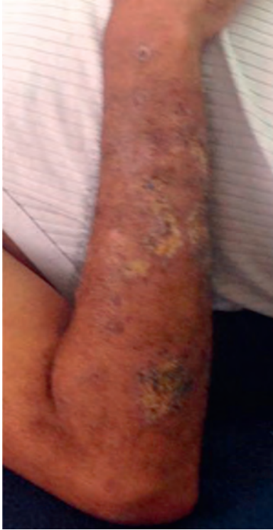
Figura 1 – Lesiones dorso brazo izquierdo. Múltiples nódulos entre 10, 20 y 30 mm de diámetro, dolorosos, algunos confluentes.