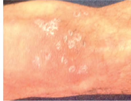
Figura 3 – Cara anterior de rodilla derecha. Múltiples nódulos entre 5 y 15 mm de diámetro respectivamente, dolorosos, algunos confluentes. Cara anterior de rodilla derecha.

la región frontal y malar, y múltiples nódulos entre 10, 20 y 30 mm de diámetro, dolorosos, algunos confluentes en antebrazos (figs. 1 y 2), y en la cara anterior de las rodillas (fig. 3). En su IPS se documenta en los paraclínicos además bicitopenia y neutropenia severa (tabla 1), por lo que lo remiten a nuestra institución.