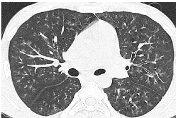
Figura 1B. TCAR corte axial. Nódulos centrilobulillares con densidad de vidrio esmerilado, de contornos mal definidos, multilobares, bilaterales.